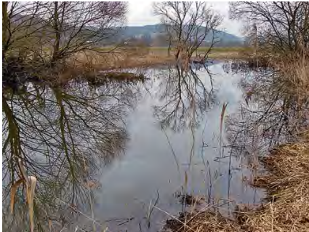
Altwasser am Main

Besonders unverständliche Fälle sind hierbei die Errichtung von Fischwanderhilfen in FFH-Gebieten. Schreibt ein Managementplan für ein FFH-Gebiet einen solchen Bau fest, sollte man annehmen, dass ihn auch anderen Behörden unterstützten. Manche Untere Naturschutzbehörde fordert für die Errichtung von Fischwanderhilfen in FFH-Gebieten allerdings Ausgleichsmaßnahmen. Einige Kraftwerksbetreiber nehmen deshalb Abstand von diesen wichtigen Projekten. Die Naturschutzbehörden verkennen die Bedeu-