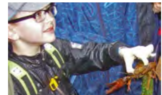
Links: Casting bei der Mainfrankenmesse Rechts: Beim Krebsförster in Rothenbuch