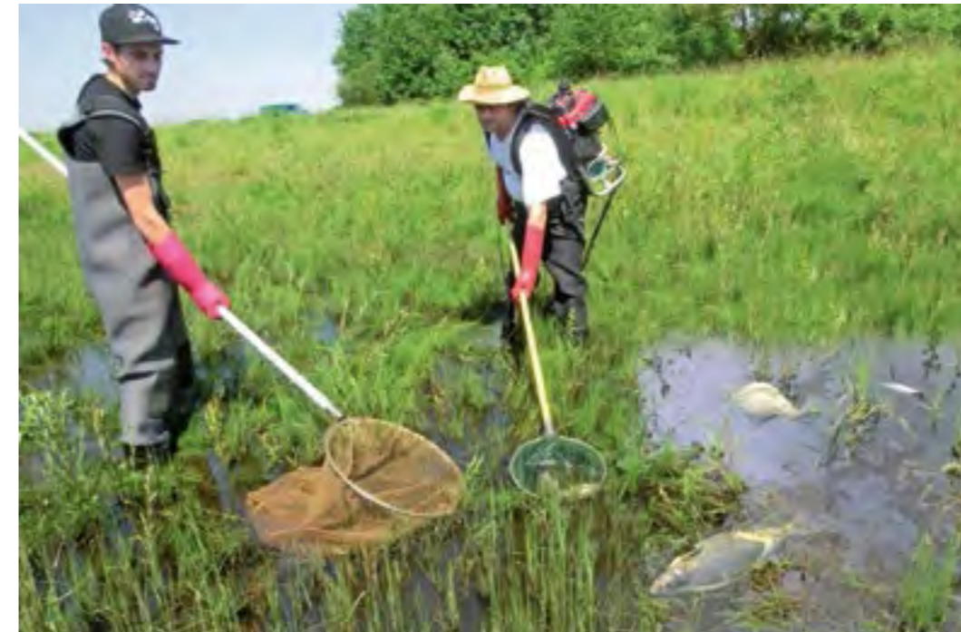
Wichtig nach jedem Hochwasser: Fischnacheile in einer Flutmulde – nicht gefangene Fische verenden.

tung von Fischwanderhilfen für die Artenvielfalt in einem Gewässereinzugsgebiet. Zum Arteninventar einer Region gehören ganz wesentlich die Fischarten. Die geforderten Ausgleichsmaßnahmen belasten Verhandlungen um Wanderhilfen mit Kraftwerksbetreibern – es muss also ohne diese gehen. Dennoch sind aber die zuständigen Naturschutzbehörden mit einzubeziehen.