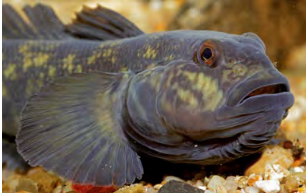
Ein Vertreter der eingewanderten Grundel-Arten ist die Schwarzmundgrundel.

Fachberatungen für Fischerei Niederbayern, Oberpfalz, Mittel-, Ober- und Unterfranken. Die Broschüre ist auf der Homepage des LFV abrufbar.