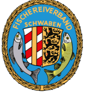
Der LFV Bayern und seine Bezirksverbände: (v.l.n.r.): Fischereiverband Oberbayern, Fischereiverband Niederbayern, Fischereiverband Oberpfalz, Bezirksfischereiverband Oberfranken, Fischereiverband Mittelfranken, Fischereiverband Unterfranken, Fischereiverband Schwaben