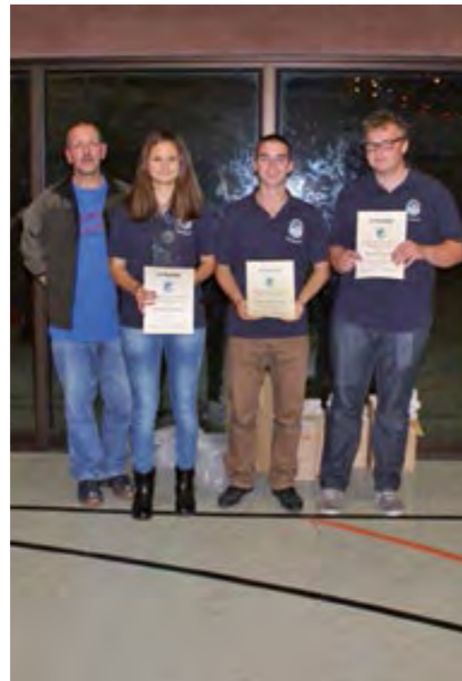
Links: Das Marine Ehrenmal in Laboe Rechts: 3. Platz Mannschaftswertung BJMT