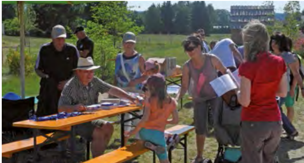
Großer Andrang am Infotisch des Fischereiverbandes Oberpfalz und des Fischereivereins Stiftland auf der Gartenschau in Tirschenreuth

Der Fischereiverband wurde am 07. März 1881 als Kreisfischereiverband für die Oberpfalz und von Regensburg gegründet. Erster Vorsitzender bis 1888 war der Königliche Regierungspräsident Maximilian von Pracher. Derzeitige Mitglieder im Fischereiverband sind 85 Vereine mit 17.629 Mitgliedern, 15 Haupterwerbs- und 17 Nebenerwerbsfischer sowie 9 Fischereigenossenschaften.