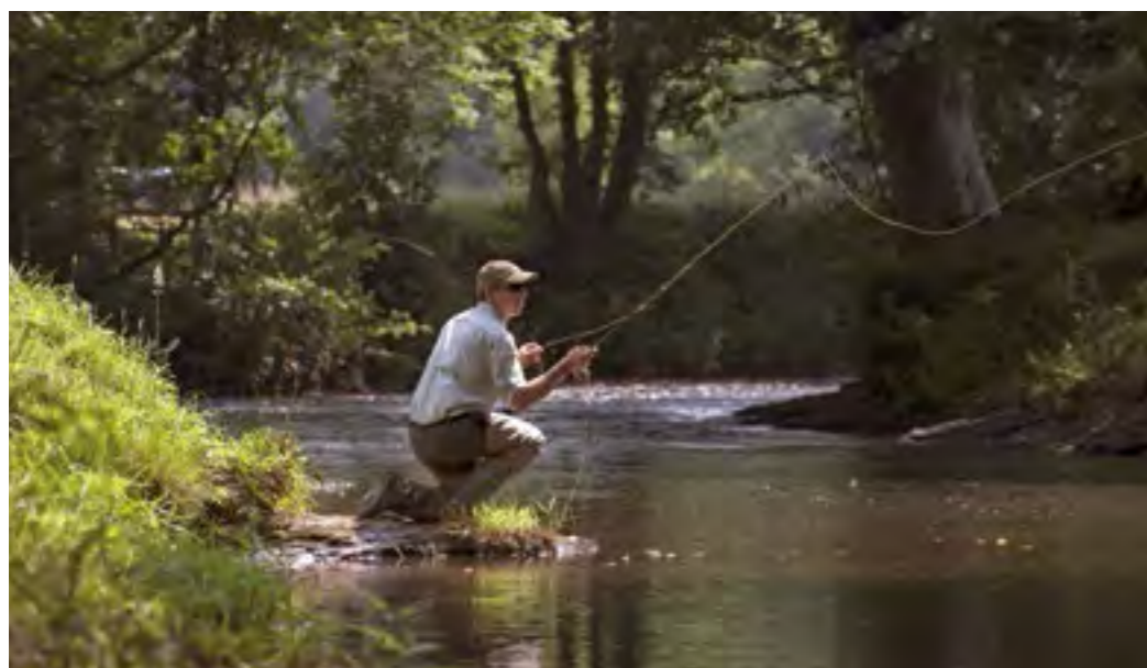
Die drei Abteilungen des LFV Bayern: Angelfischerei, Casting und Berufsfischerei