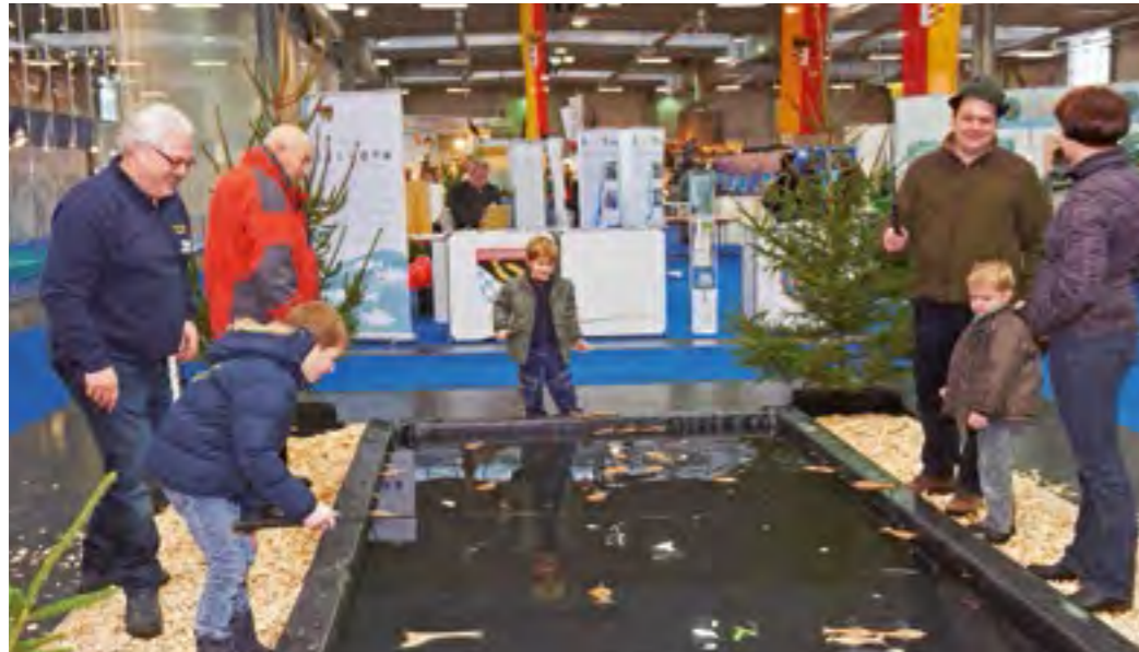
Angelspaß auf der Messe JAGEN UND FISCHEN in Augsburg