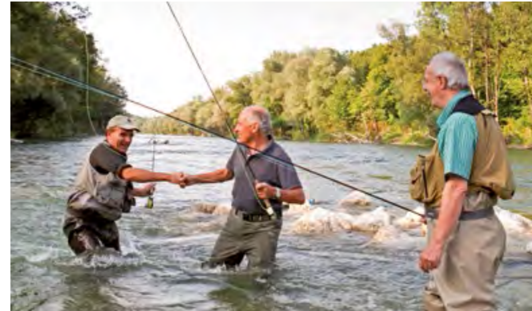
Auch Angelfischerei kann Teamwork sein.