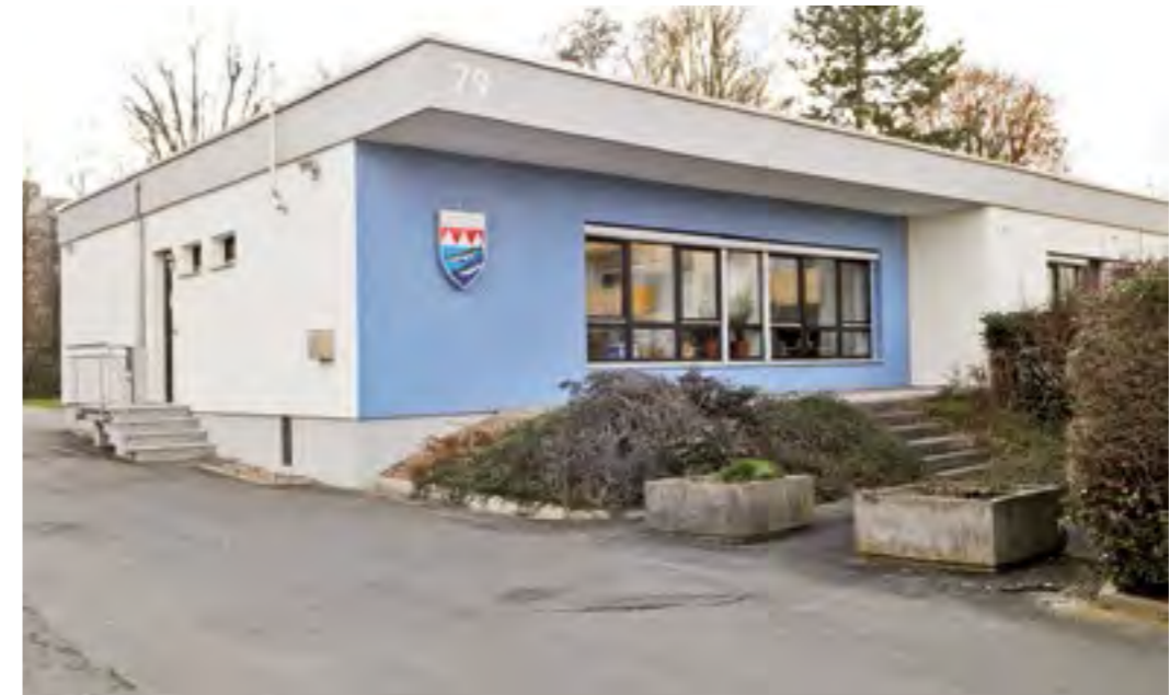
Die Geschäftsstelle des Fischereiverbandes Unterfranken ist die direkte Anlaufstelle für die Mitglieder.