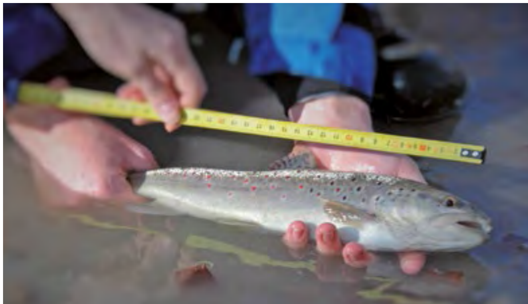
Diese Bachforelle hat das Schonmaß erreicht.

Der LFV überarbeitete 2013 den Fragenkatalog zur staatlichen Fischerprüfung komplett. Begleitet durch eine Arbeitsgruppe von Fachleuten und Praktikern aus Vereinen, Bezirksverbänden und dem Gerätehandel wurden veraltete Fragen gestrichen und durch aktuelle ersetzt.