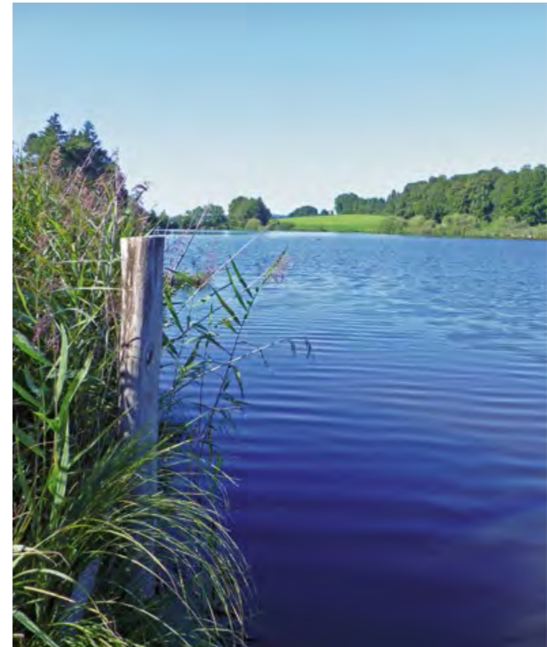
Der Bergknappweiher ist seit 1909 im Eigentum des LFV Bayern.

rechtsvertrags vom 22.12.1982 für 99 Jahre an den Freistaat Bayern verpachtet. Das Institut für Fischerei der Landesanstalt für Landwirtschaft steht auf dem Gelände. Der LFV Bayern erhält vertragsgemäß eine jährliche Pacht vom Freistaat Bayern. Des Weiteren gehören zu den Liegenschaften des LFV Bayern einige Fischereirechte an Fließgewässern und Teichen. Anfang 2013 wurden drei Teiche in der Gemarkung Bernried zur Finanzierung einer neuen Geschäftsstelle verkauft. In Oberbayern besitzt der LFV Bayern nunmehr noch 4 Fischereirechte mit insgesamt 13 ha, in Niederbayern zwei mit zusammen 5 ha und in Schwaben zwei mit 8 ha.