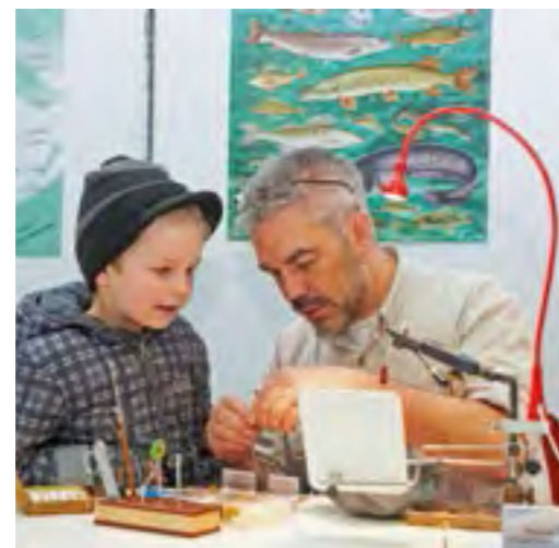
Faszination Fliegenbinden auch für „Jungfischer“