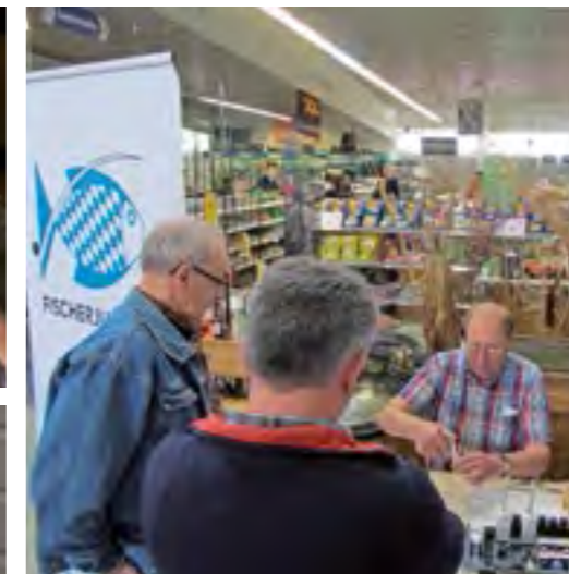
Mitte rechts: Vorführung einer Gewässeruntersuchung beim Infotag in Neumarkt