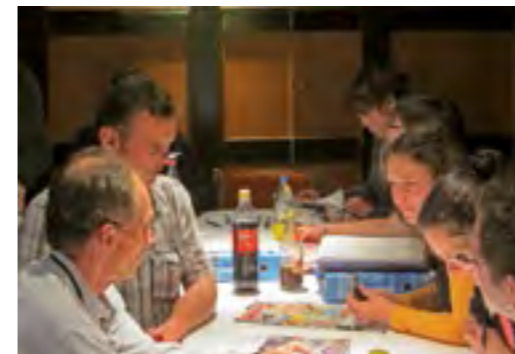
Mitte links: Gruppenarbeit bei der Jugendleiterschulung