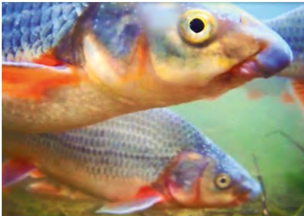
Nasenschwarm im Close-Up

Als anerkannter Naturschutzverband und Vertreter der Fischer sieht sich der LFV Bayern berufen, den Begriff „Vorranggewässer“ zu konkretisieren. In Zusammenarbeit mit anderen fischereilichen Institutionen erarbeitet er Vorschläge und Empfehlungen, mit welchen Strategien und Maßnahmen für charakteristische Fischarten oder Fischartengemeinschaften in den unterschiedlichen Einzugsgebieten Bayerns die aktuelle Lebensraumsituation verbessert werden kann.