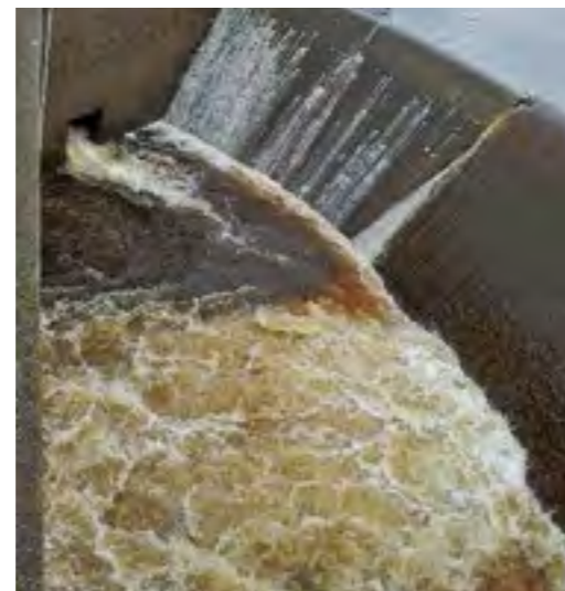
Jede Menge Wasser, doch die Fischerjugend lässt sich nicht abschrecken!

Im nächsten Jahr führt die Bezirksjugendleitung Oberfranken ihr Jugendausbildungszeltlager erstmals in Zusammenarbeit mit dem FV Schwarzenbach/Saale und dem Fischereiverein Weißenstadt durch.