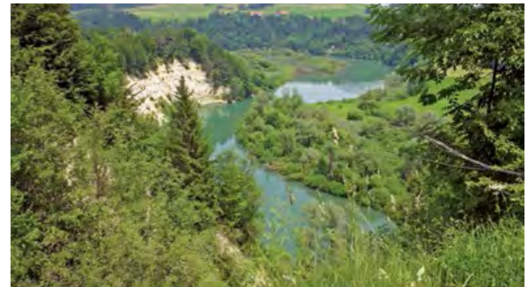
Der Illerdurchbruch bei Kalden gehört wohl zu den eindrucksvollsten Gewässerstrecken in Schwaben.

Besonders stolz ist man in Schwaben auf die hervorragende Jugendarbeit im Verband. Ein enga-