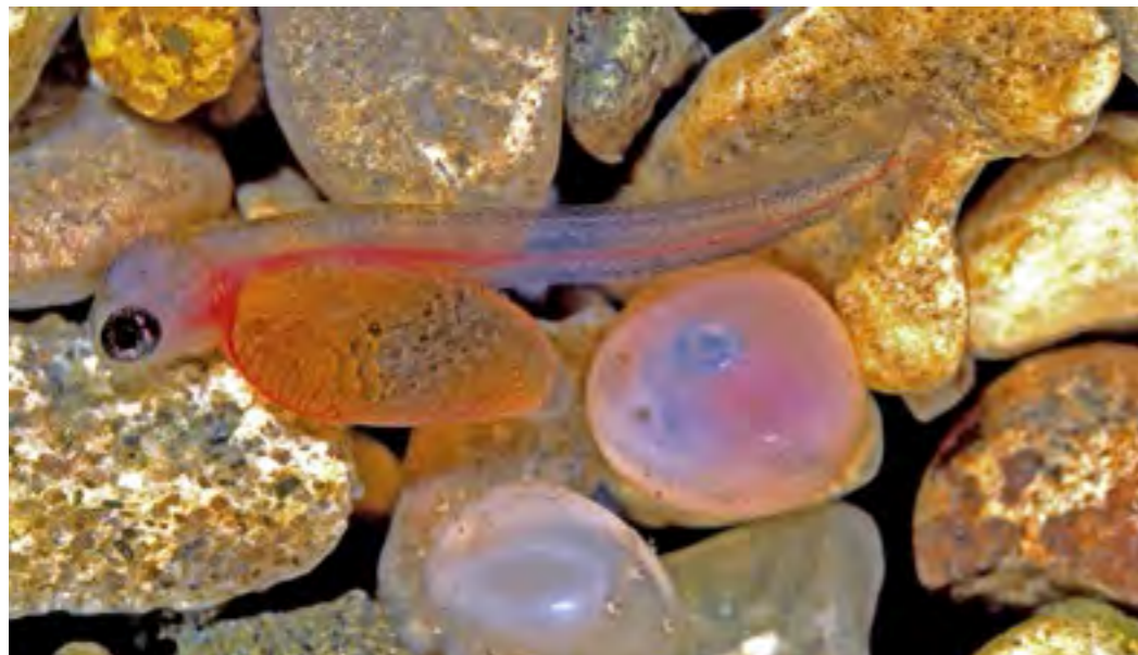
Bachforelle - Dottersacklarve unmittelbar nach dem Schlupf