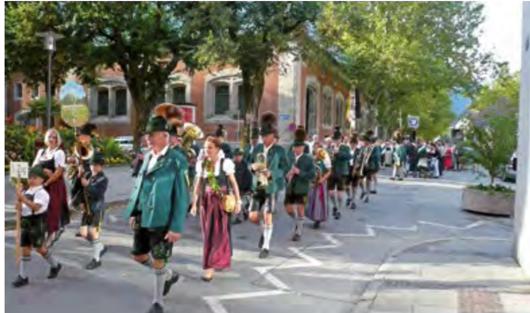
Tradition und Fortschritt müssen kein Widerspruch sein. Das beweist der Fischereiverband Oberbayern bei seinen von der Öffentlichkeit viel beachteten Veranstaltungen, unter anderem aktuell beim Oberbayerischen Fischereitag in Bad Reichenhall.

Gewässerrenaturierungen, Artenschutzprogramme, Durchgängigkeit der Fließgewässer, Wasserkraft, Messeauftritte, Nachschulungen für Gewässerwarte sowie Fischereiaufseher und eine intensive Öffentlichkeitsarbeit: Der Fischereiverband Oberbayern war im abgelaufenen Jahr auf vielen Tätigkeitsfeldern aktiv und verbuchte große Erfolge für die Fischerei. Die Anstrengungen der ehrenamtlichen Mannschaft und einer hauptamtlichen Kraft in der Geschäftsstelle waren enorm und am Rande des Machbaren. Der Fischereiverband Oberbayern steht jedoch zum Prinzip der Ehrenamtlichkeit und will auch weiter an ihm festhalten – es gewährleistet die Mitwirkung vieler Akteure. Zwar bedeuten viele unterschiedliche Meinungen intensivere Auseinandersetzungen, aber gemeinsam statt einsam ist angesagt. Der Verband vertritt 35.000 Angelfischer, davon 3.400 Jugendliche, setzt sich zusammen aus über 220 Einzelvereinen und Genossenschaften und nimmt sich auch der Anliegen der Berufsfischerei sowie der fischproduzierenden Betriebe an. Im Hauptausschuss des Fischereiverbands unterstützen hochqualifizierte Fachbeiräte mit ihrem Wissen den Verband.