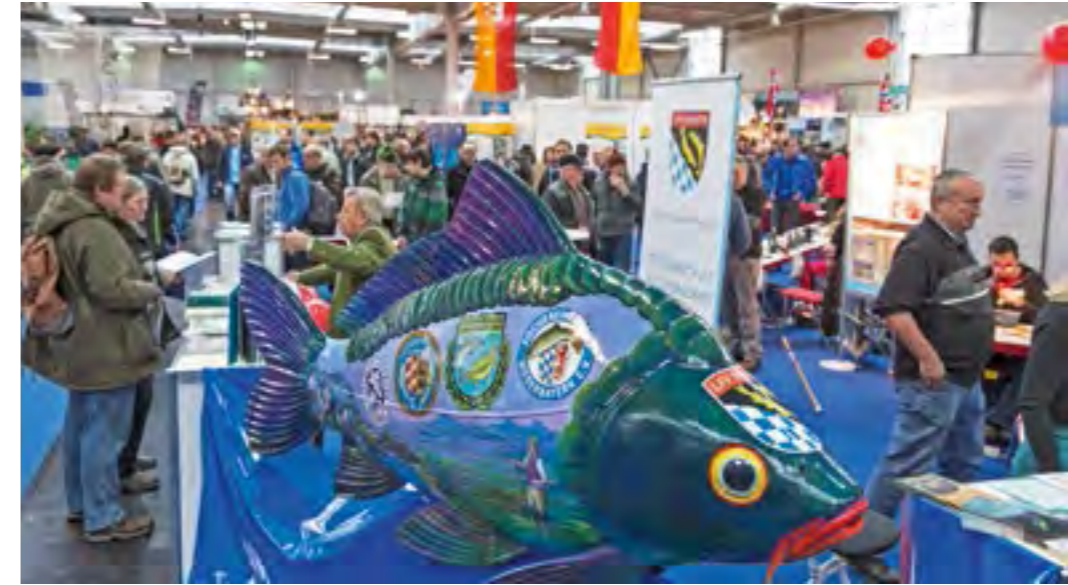
Der Gemeinschaftsstand der Fischerei auf der JAGEN & FISCHEN in Augsburg war stets gut besucht.

nacher Ohe sorgte ebenfalls für ein großes Medienecho. Zwei Kamerateams verfolgten die Bauarbeiten vor Ort, Vertreter der Fischerei kamen ausgiebig zu Wort.