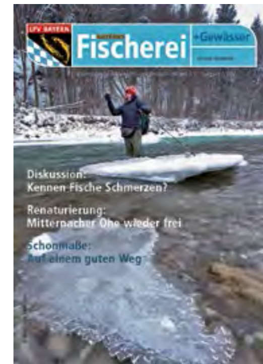
Viel gelesen: Bayerns Fischerei + Gewässer - die Mitgliederzeitschrift des LFV

Kontakt zwischen Schulen und Vereinen her. Ab 2014 übernimmt die Bayerische Fischerjugend das Projekt, Experten überarbeiten dafür das Material.