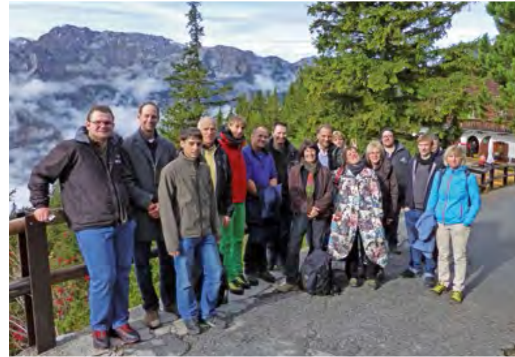
Betriebsausflug der Mitarbeiter der Geschäftsstelle, der Fischzucht Mauka und des Präsidenten zur „Eisriesenwelt“ nach Werfen.