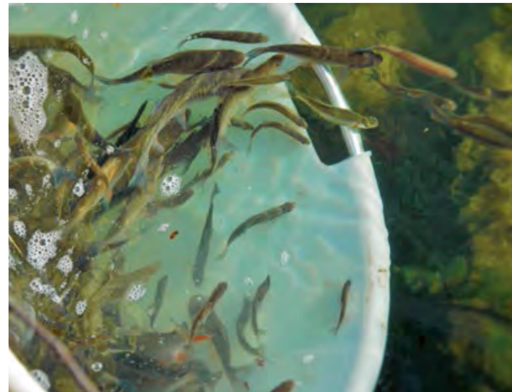
Fischbesatz für den Artenschutz