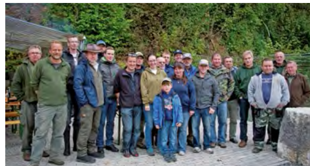
Oben: Jugendleiterabfischen in Kiefersfelden

Nach der Begrüßung und einer ersten Stärkung ging es trotz Kälte und auffrischendem Wind an