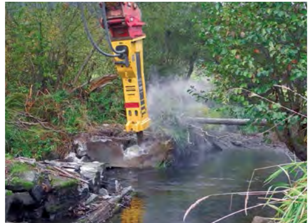
Rückbau der Wasserkraftanlage Mitternachtsmühle – Schweres Gerät macht den Weg für das Wasser wieder frei.

In Zusammenarbeit mit dem Umweltministeriums beauftragte der LFV die Kartierung und Befischung von Vorranggewässern für die EU-Wasserrahmenrichtlinie. Die Gewässer lagen in allen sieben Regierungsbezirken. Leider waren wegen Zeitmangels nur einmalige Befischungen pro Gewässer möglich. Die Ergebnisse wurden deshalb in Abstimmung zwischen dem bayerischen Landesamt für Umwelt und dem LFV in einem „expert judgement“ kalibriert. Für das Projekt liegt ein Ergebnisbericht vor.