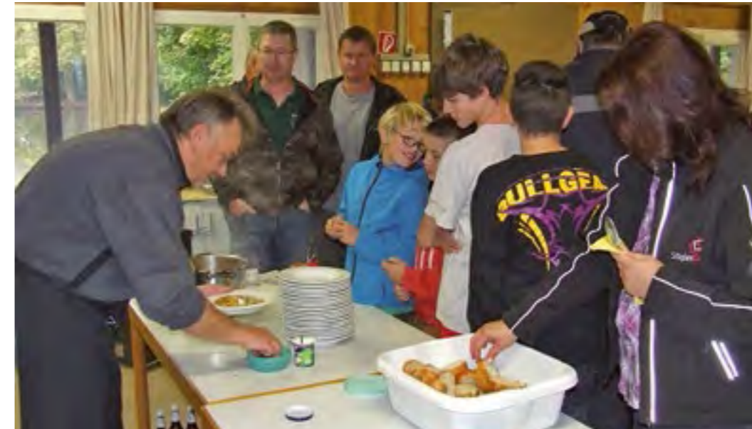
Lecker Suppe beim Fischkochkurs Basic