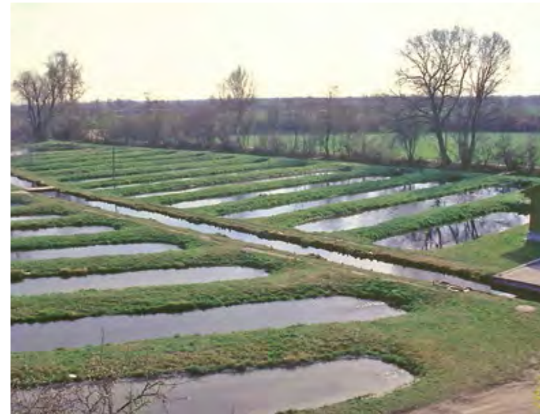
Eine Forellenzucht aus der Vogelperspektive

Die Umsetzung der Aquakulturrichtlinie wurde von der Politik leider noch nicht zur Zufriedenheit der Fischzüchter ausgestaltet. Probleme macht der Umgang mit betroffenen Zuchtbetrieben