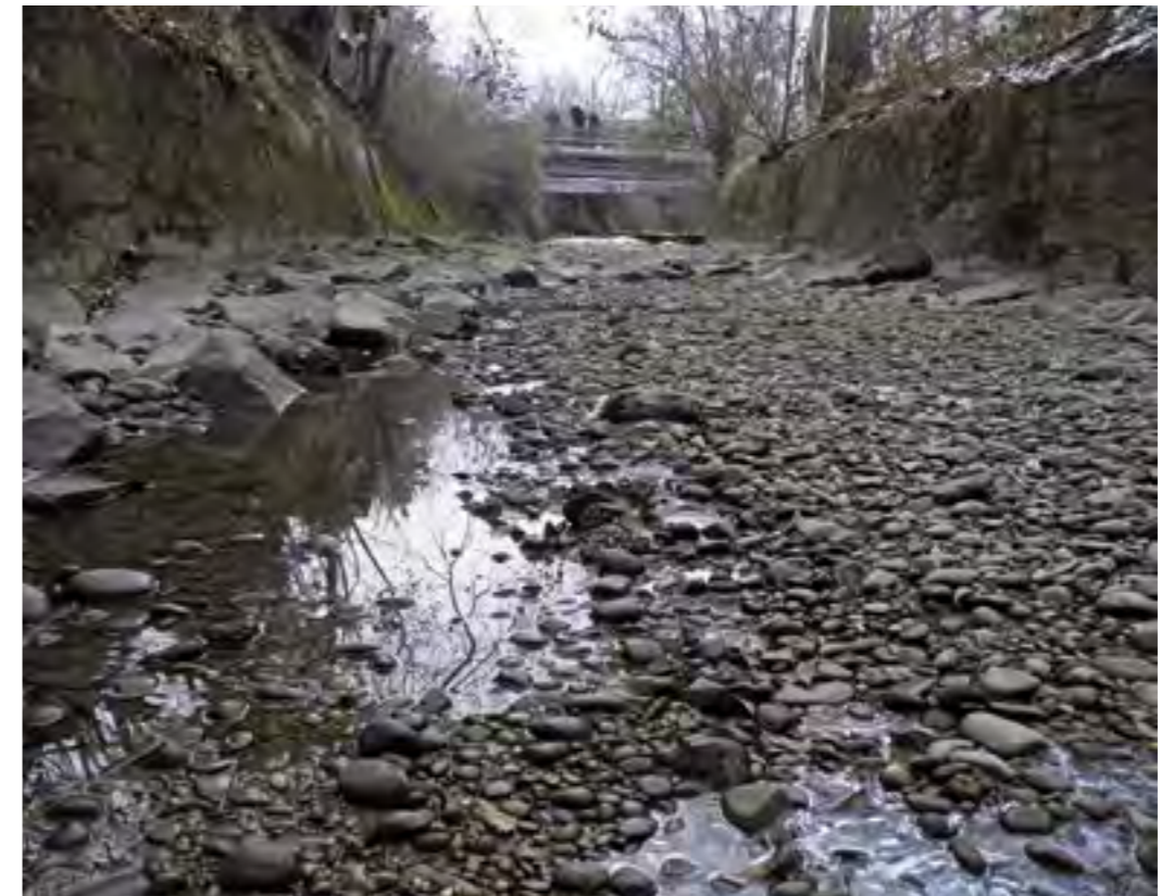
Wo das Wasser fehlt, gibt es kein Leben. In der Mindel in Mindelheim kann man nicht mehr von Restwasser sprechen.

Durch begleitende Verbesserungsmaßnahmen in Bezug auf Jungfisch- und Adultfischhabitate und durch eine bessere Vernetzung dieser Teilhabitate könnte der Reproduktionserfolg der künstlichen Laichplätze und damit die Populationsdichte erhöht werden. Daher sollte in stark anthropogen beeinflussten Gewässern, die einen