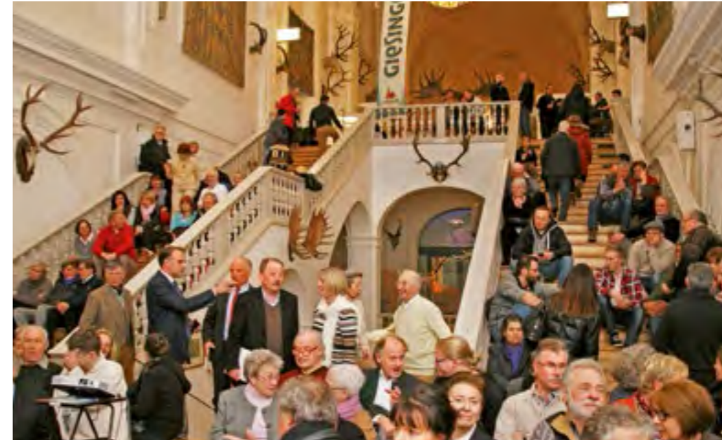
Hier finden Bildung und Vergnügen zusammen: das Deutsche Jagd- und Fischereimuseum

ben, Teichwirtschaften und Angelgewässern. Dabei ist die rasche Krankheitsfeststellung entscheidend für erfolgreiche Gegenmaßnahmen. Einen wesentlichen Anteil hat hier auch die Untersuchung und Beurteilung des Wassers als Lebensraum der Fische. Der LFV Bayern arbeitet seit Jahrzehnten eng mit dem Fischgesundheitsdienst zusammen, sei es im Rahmen von Projekten oder bei den Bemühungen bzgl. des richtigen Umgangs mit der Fischseuchenbekämpfung. In diesem Zusammenhang ist der Fischgesundheitsdienst auch beim Ausschuss für Fischerei und Gewässerschutz als ständiger Gast geladen. Sie erfahren mehr über den TGD unter www.tgdbayern.de