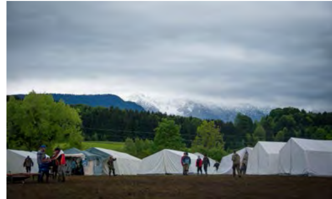
Das Ausbildungszeltlager des FV Oberbayern vor herrlicher Kulisse

Auch 2013 organisierte die Bezirksjugendleitung viele Aktionen und Veranstaltungen. Ein jährliches Highlight ist das Ausbildungszeltlager, welches aufgrund der Witterungsverhältnisse dieses Jahr nicht so schnell in Vergessenheit geraten wird.