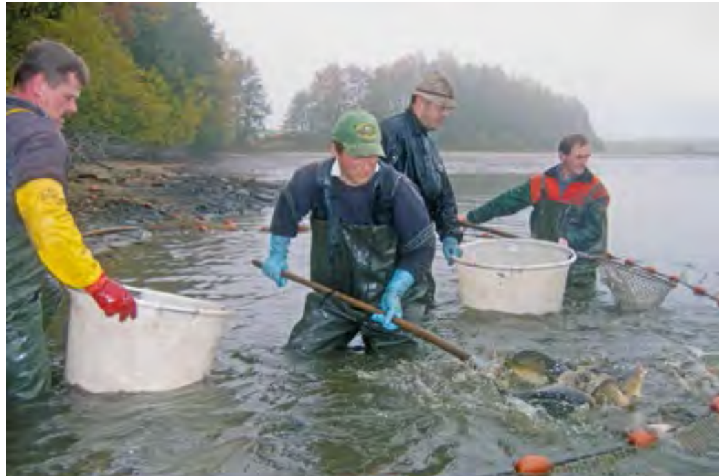
Hier ist Zupacken gefragt – Teichabfischung in der Oberpfalz