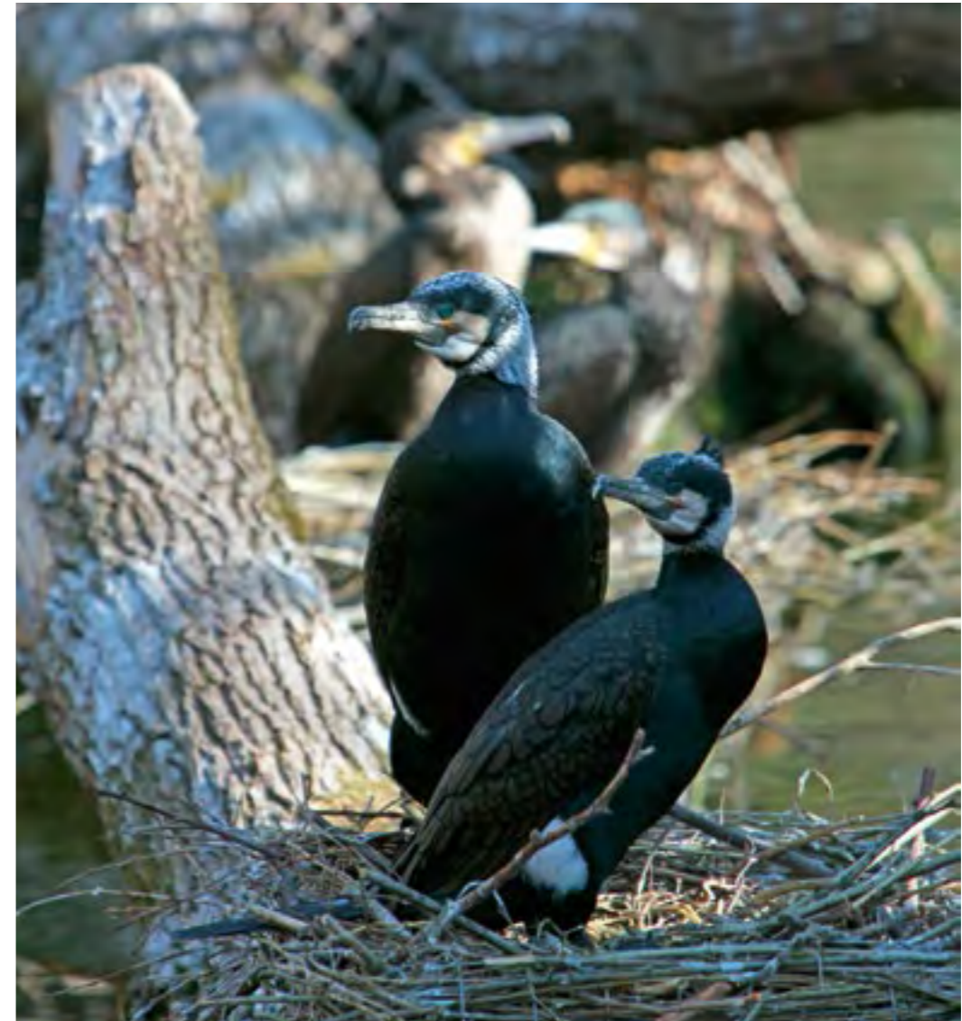
Der Kormoran ist kein einheimischer Brutvogel. Neue Brutkolonien zu verhindern, stellt den LFV vor Herausforderungen.

Kameras vergeben. Es wurde getestet, inwieweit diese als „Action-Kameras“ geläufigen Modelle für Fischbestands- oder Verhaltens-Aufnahmen geeignet sind. Der Einsatz erfolgte in Gewässern, in denen AHP-Arten besetzt wurden. In einigen Fällen konnten AHP-Arten nachgewiesen werden. Dem Ref. III wurde ein Bericht über die Einsatzmöglichkeiten dieser Kameras vorgelegt. Das Dokument steht auf der Homepage des LFV zum Download zur Verfügung.