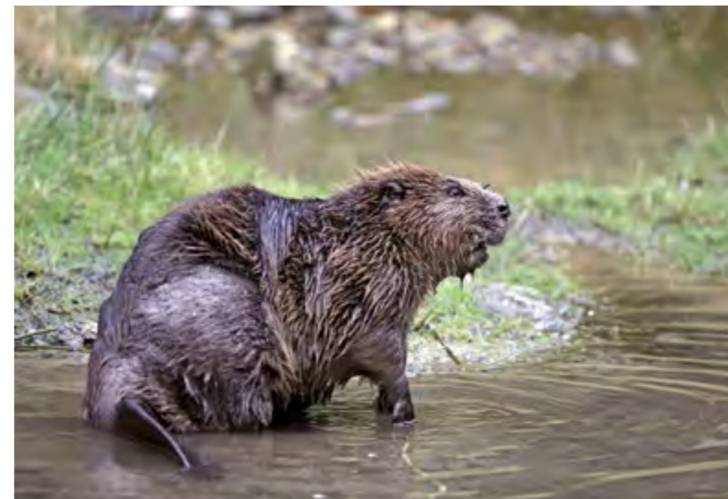
Der Biber hat in ganz Bayern in seinem Bestand stark zugenommen. Seine natürliche Bautätigkeit verursacht in der Karpfenteichwirtschaft teils große Schäden.

Basierend auf den umfassenden Untersuchungen der Vorjahre wurde 2013 eine Broschüre „Schwarzmeergrundeln in Bayern“ herausgegeben. Beteiligt an dem Gemeinschaftsprojekt waren die Technische Universität München, die Universität Basel, die zoologische Staatssammlung München, das Institut für Fischerei sowie die