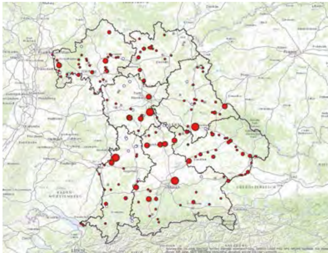
Mit der interaktiven Online-Kormoran-Karte kann man den gewünschten Kartenausschnitt vergrößern und erhält den exakten Überblick über die Schlafplätze.

moranzählung ist wie gewohnt auf www.lfvbayern.de mit den Listen der Zählraten sowie den GIS-Karten des LFV veröffentlicht.