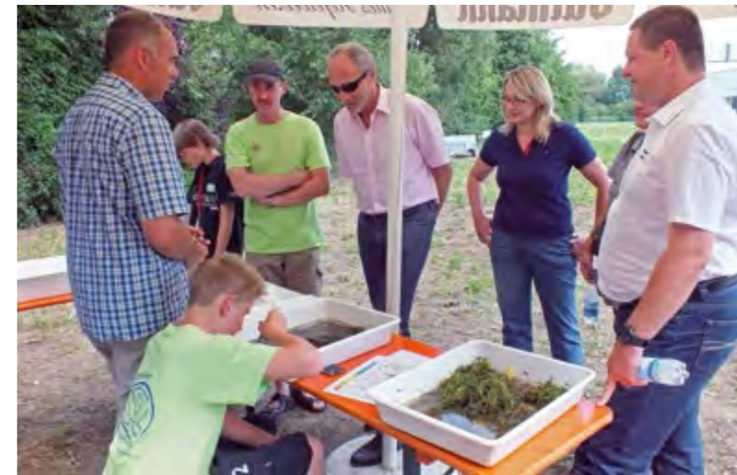
Das Wasserwirtschaftsamt Donauwörth informiert beim Jugendfischereitag über die „Erlebniswelt Wasser“.

417 Teilnehmer, aus 35 Vereinen, davon 301 Jugendliche und 116 Betreuer. 65 Fische wurden gewertet