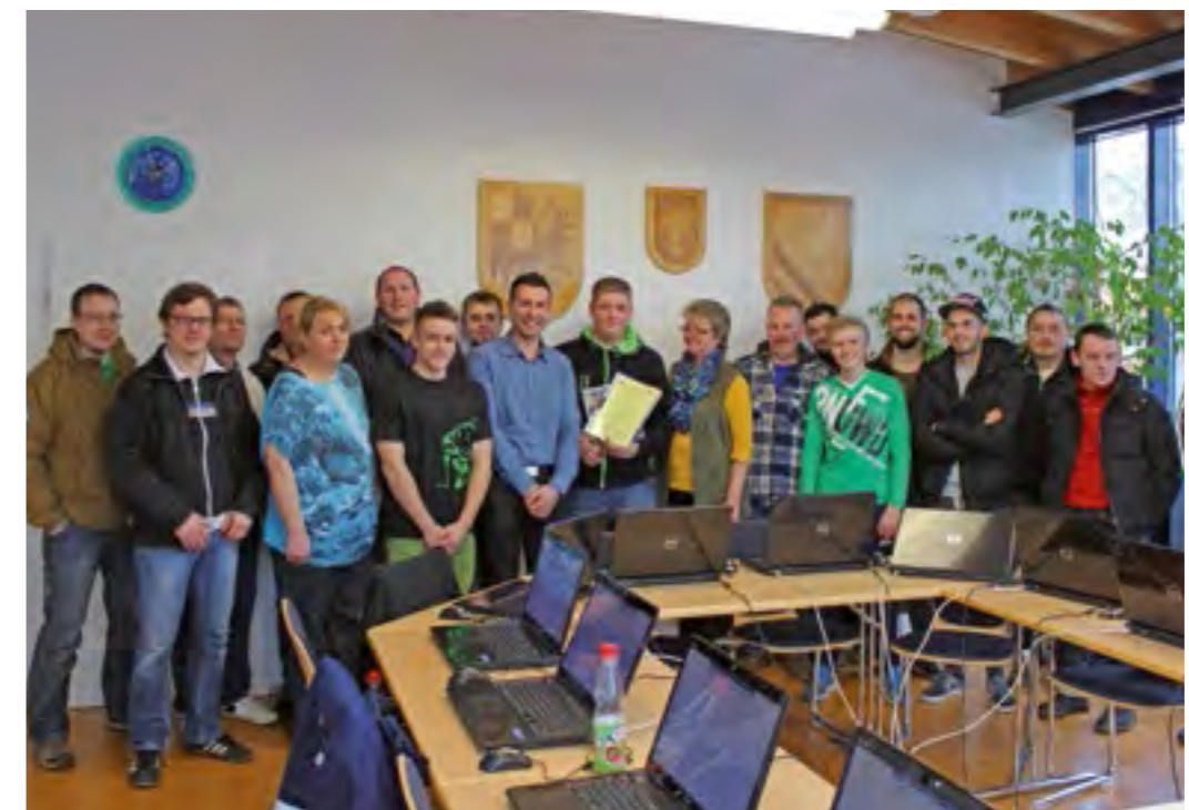
Erinnerungsurkunde für den tausendsten Teilnehmer an der Online-Fischerprüfung im Haus der Fischerei in Mittelfranken

In einer Übergangsfrist bis 2014 kann der Kandidat wählen, ob er am Onlineverfahren teilnimmt oder lieber die bisherige schriftliche Prüfung ablegt. Da beiden Prüfungsformen derselbe verbindliche Fragenkatalog zugrunde liegt, ist auszuschließen, dass die Fragen der Onlineprüfung schwerer zu beantworten sind als die der schriftlichen Prüfung; zumal künftig etliche Bilderfragen die Prüfung auflockern werden.