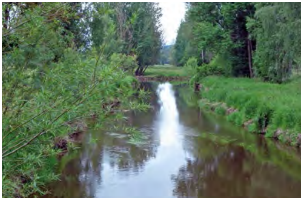
Staatliches Fischereirecht an der Pfreimd im Bezirk Oberpfalz

Landesamt für Vermessung und Geoinformation startete dafür ein Pilotprojekt in Mittelfranken.