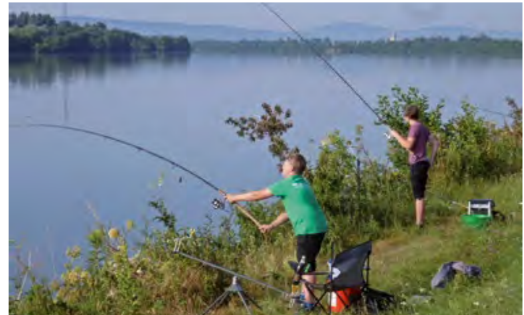
Bei strahlend blauem Himmel fand das diesjährige niederbayerische Jugendkönigsfischen des Fischerverband Niederbayern e. V. in Straubing statt.