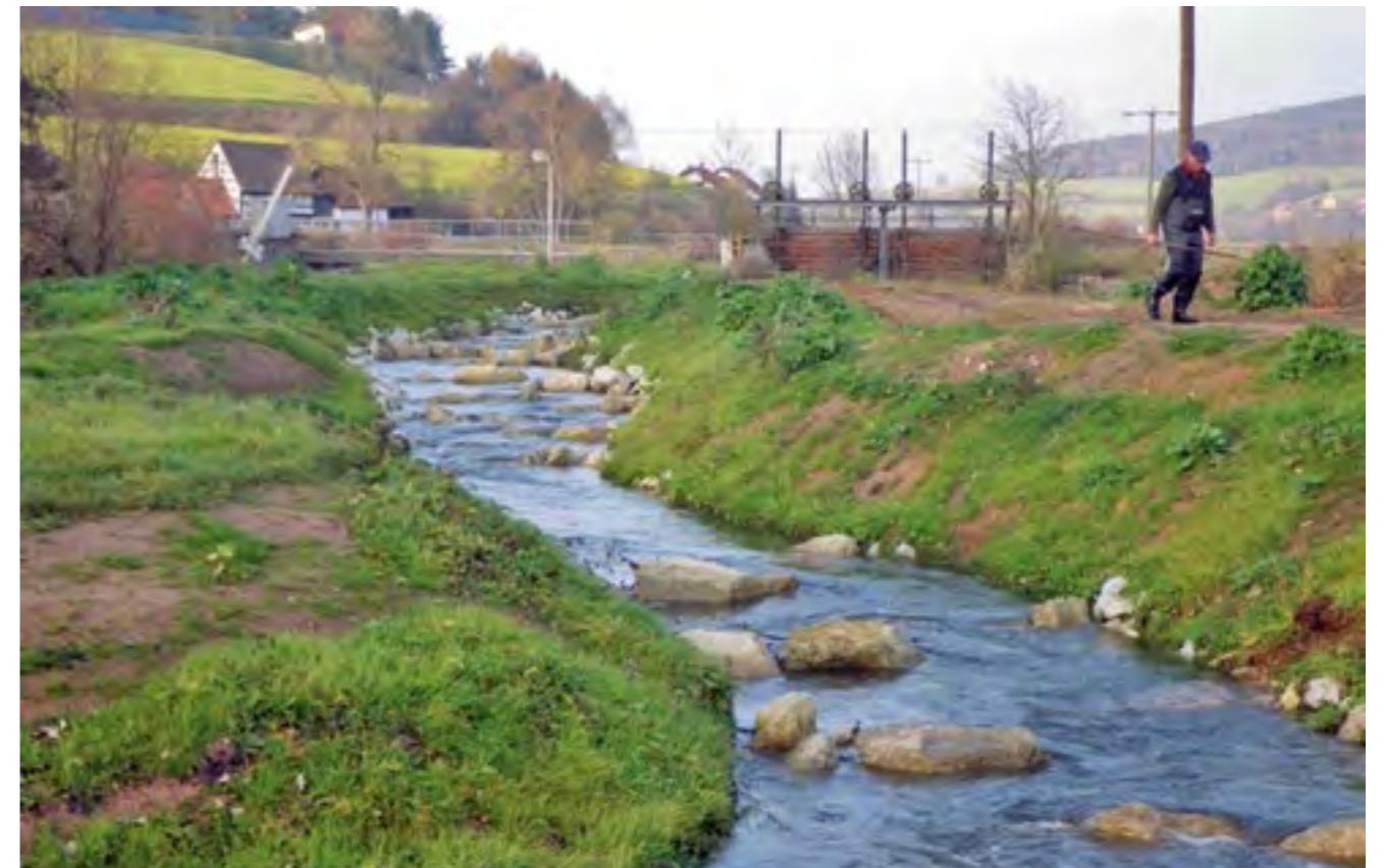
Fischwanderhilfe an der Itz