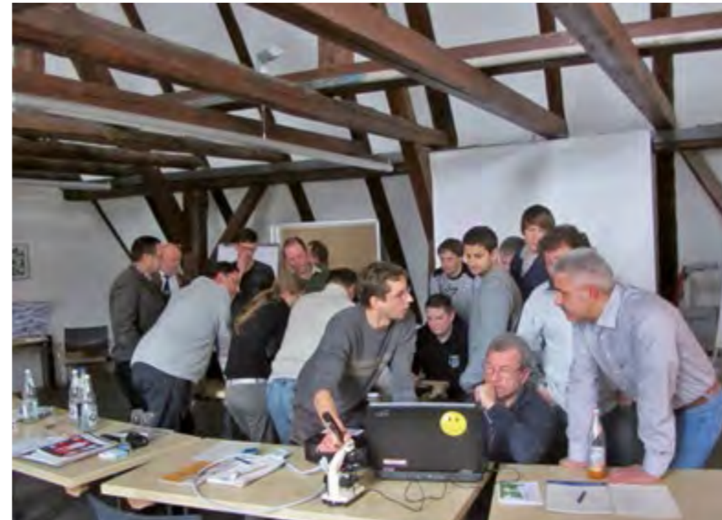
Oben: Neue Welten durch Digitalmikroskopie beim Fachforum Jugendleiter Gruppenarbeit bei der Jugendleiterschulung

Das Engagement der beteiligten Fischereivereine machte das bayernweite, lehrreiche Seminarangebot 2013 erst möglich. Die vielen Referenten, Organisatoren vor Ort und Helfer steckten viel Zeit und Liebe in die Planung, Vorbereitung und Durchführung. Sie fördern so erfolgreich die Aus- und Weiterbildung der Jugendleiter- und legen damit den Grundstein für die qualitativ hochwertige Jugendarbeit in der Bayerischen Fischerjugend.