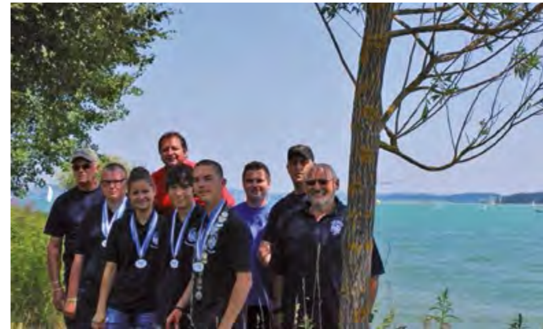
Die Mannschaft der Oberpfalz mit Betreuern