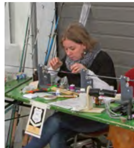
Mitte rechts: Ruten selbst gebaut - der Infotag macht es möglich!