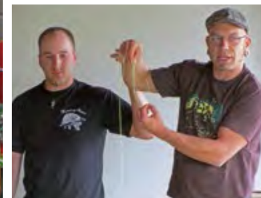
Unten rechts: Teilnehmerpräsentation beim Grundlagenseminar Jugendarbeit