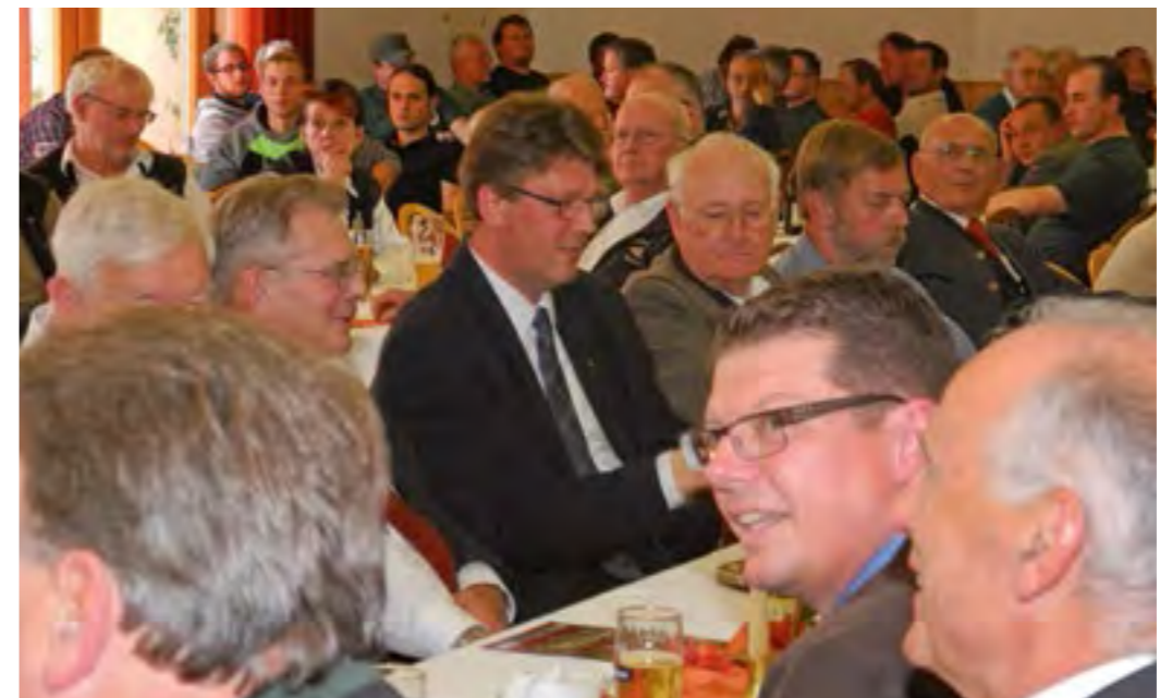
Schaufenster der bayerischen Fischerei: der Landesfischereitag des LFV

Minister Brunner signalisierte seine Unterstützung für mehrere Anliegen der Fischerei. Er versicherte, die Wasserkraft werde nicht mehr so ungebremst