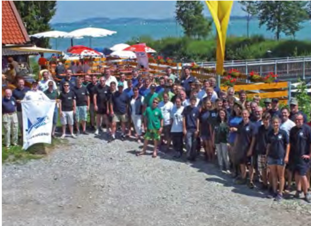
Das bayerische Jugendkönigsfischen am Forggensee erfreute sich reger Teilnahme.

Im schwäbischen Schwangau in der Nähe von Füssen am Forggensee fand das diesjährige Bayerische Jugendkönigsfischen am 20. und 21. Juli statt. Der gastgebende Fischereiverein Füssen und die Bezirksjugendleitung Schwaben stellten eine gut organisierte Veranstaltung auf die Beine. Fünf Mädchen und 21 Jungen nahmen aufgegliedert in sieben Bezirksmannschaften teil.