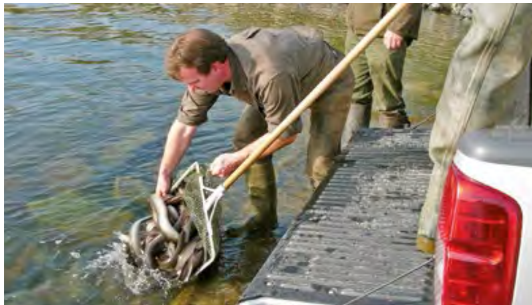
Unterfrankens Mainfischer beteiligen sich an der Rettung des europäischen Aals.

Nach den Messetagen machte sich etwas Müdigkeit breit, aber insgesamt waren alle mit dem Auftritt sehr zufrieden. Der Verband ist davon überzeugt, dass sich die Mühe gelohnt hat.