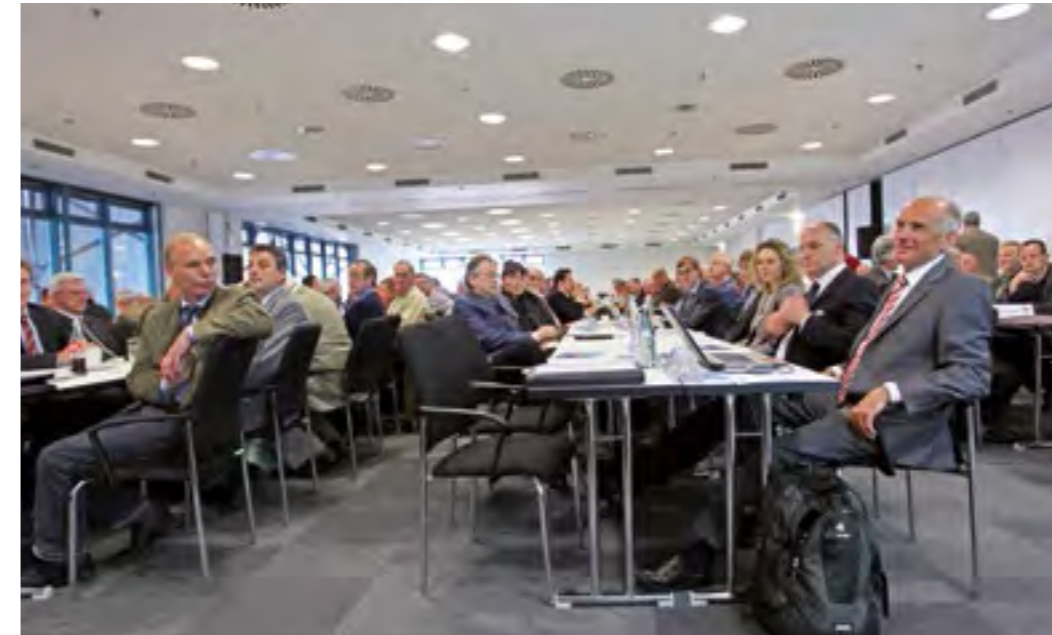
Gespannte Zuhörer auf der LFV-Mitgliederversammlung 2013.