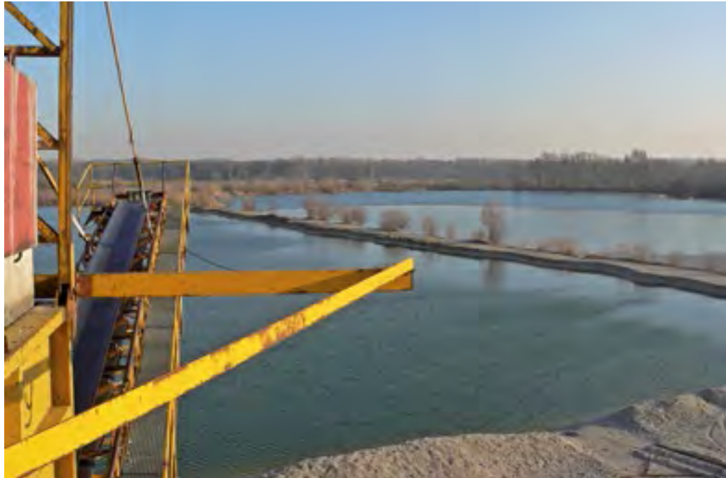
Baggersee bei Marzling