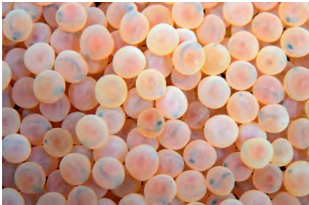
Erbrütung von Forelleneiern in einem sogenannten „Unterstromkasten“

Die Nachfrage nach Regenbogen-, Lachs- und Bachforellen sowie Saiblingen war 2013 stark. Trotzdem war es den Fischern nicht möglich, die Preise auf ein nachhaltiges Niveau zu heben. Die Erträge reichen oftmals nicht aus, um die Kosten zu decken.